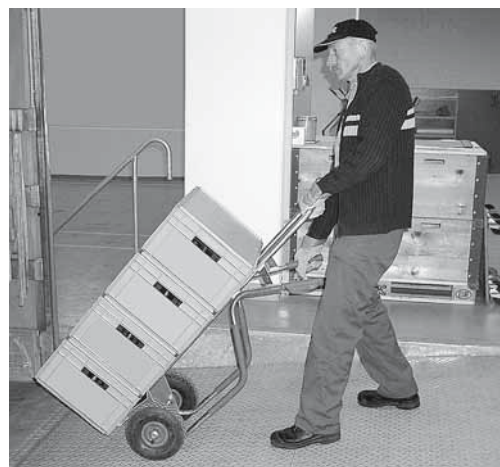
Figure 1: zone de chargement et de déchargement suffisamment éclairée et protégée de l'humidité.