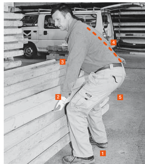
Figure 4: comment soulever correctement?