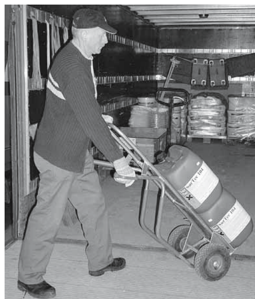
Figure 2: utilisation d'équipements appropriés.