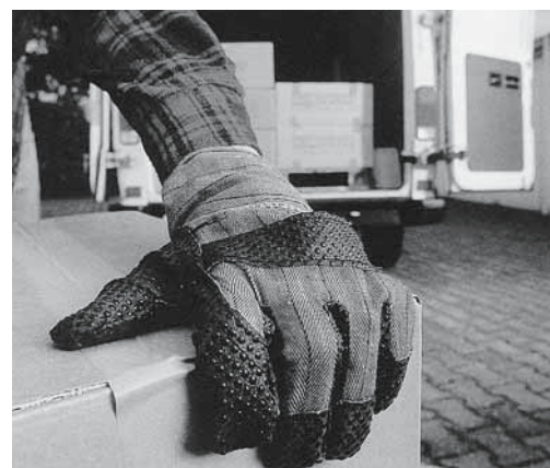
Figure 5: des gants protègent des blessures.